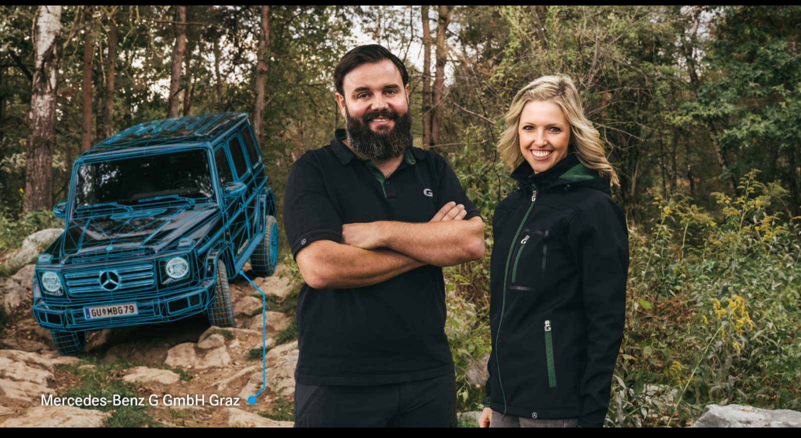
Mercedes-Benz G GmbH Graz