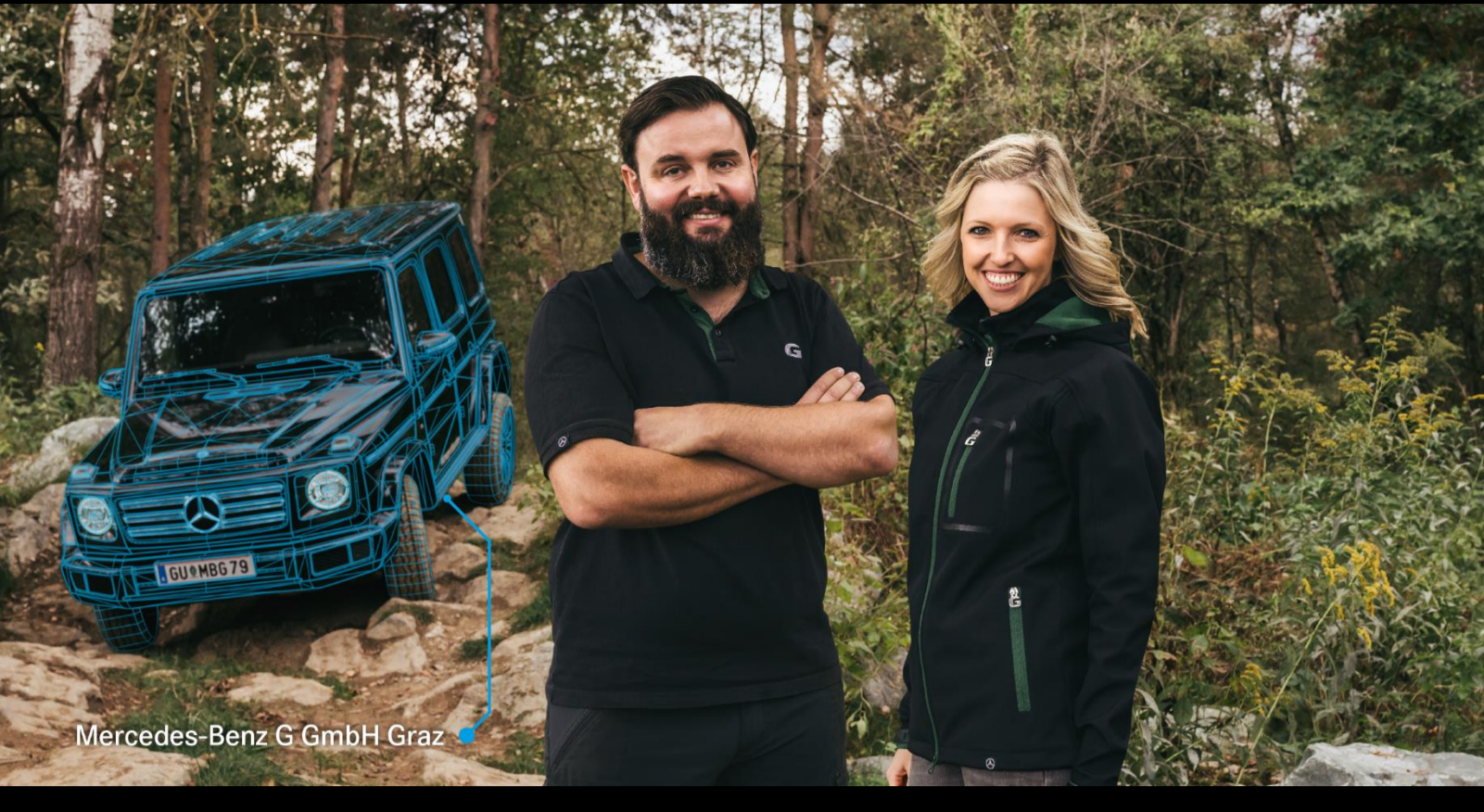
Mercedes-Benz G GmbH Graz