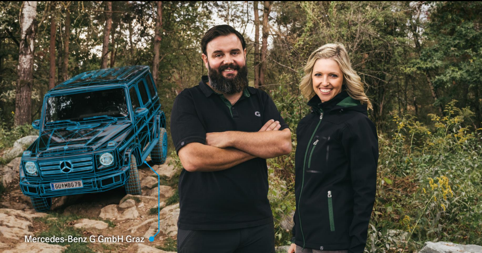
Mercedes-Benz G GmbH Graz